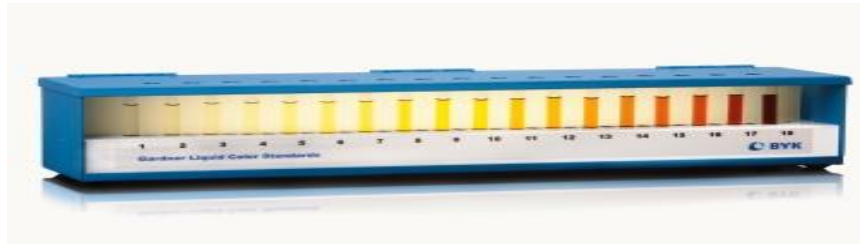
Le Comparateur de Standards de Couleur Liquide Gardner

Les colles Epoxy optiques sont souvent formulées à partir de plusieurs lots produits de bases différents, chacun d'entre eux peut avoir, d'un lot à l'autre, des variations de couleurs. Toutes les couleurs des lots de matières premières sont validées avec le Comparateur de Standards de Couleur Liquide Gardner.