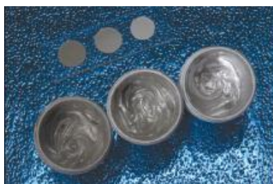
Trois variations de couleurs de colles Epoxy électro conductrices non polymérisées

Ces variations de particules d'argent dépendent de plusieurs facteurs : La granulométrie de la poudre de base, la durée et le temps de traitement des particules. Une fois que ces particules ont subi le traitement approprié, elles sont soumises à des tests de performances qualités. Quand le lot spécifique de particules d'argent est approuvé, il peut alors être incorporé dans une résine ou un durcisseur pour être de nouveau testé pour s'assurer que les caractéristiques électriques demandées à la colle Epoxy en questions sont bien validées.